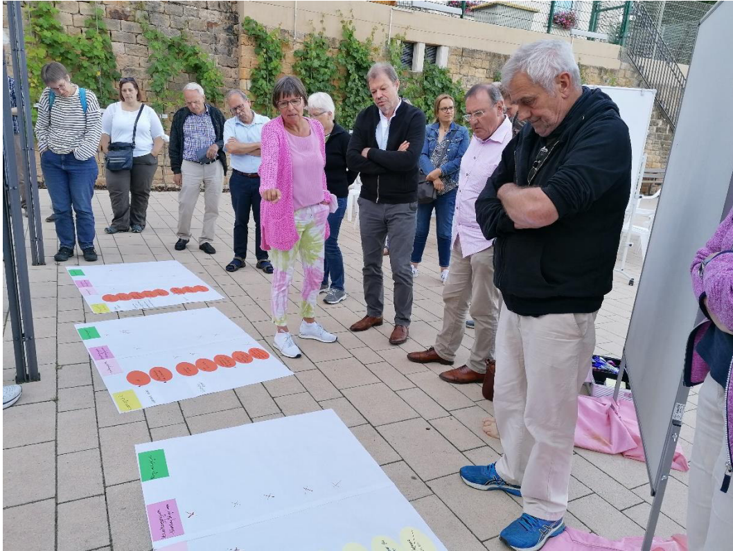
Abbildung 2: Vorstellung der Ergebnisse des Arbeitstisches "Leitprojekte" 7.7.21

Auf diese Weise haben sich einige Projekte herausgefiltert, die sich zur Mitwirkung der Bürger:innen eignen und die nach anschließender Abfrage der Teilnehmer:innen des Arbeitstisches Grundlage für drei Projektgruppen bilden. So haben sich einige Bürger:innen für eine Projektgruppe zusammen getan, die sich mit den Projekten Sportplatz (Wald), Dirtbike-Strecke und Klettergarten beschäftigen wollen. Eine andere Projektgruppe hat den Schwerpunkt auf die Entwicklung/Gestaltung einer Dorfmitte mit einem Dorfgemeinschaftshaus, inkl. Dorfladen gelegt. Inhalt der Arbeiten einer dritten Gruppe bildet schließlich die Gestaltung und Etablierung von Treffpunkten und Plätzen in Haardt (Bsp. Dorfplatz). Die Weiterarbeit an diesen Projekten wird in den jeweiligen Gruppen stattfinden. Diese sollen in eigener Organisation und Verantwortung der Dorfgemeinschaft tagen.