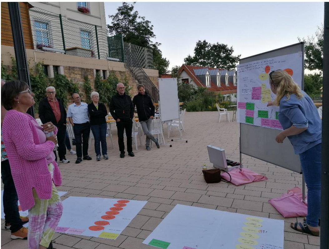
Abbildung 3. Vorstellung der Ergebnisse des Arbeitstisches "Profilidee", eigene Aufnahme 7.7.21

Die weiteren großen Potenziale der Haardt sind die stadtnahe Lage/Struktur und die Nähe zur Natur . Hierbei sind die Übergänge fließend, denn die architektonische Vielfalt zeigt sich nicht nur in der schönen Dorfstraße mit historischer Bebauung mit ortstypischem Sandstein und dem Haardter Schloss, sondern z.B. auch durch die Welsch-Terrassen und die Wolf'sche Anlage. Beide tragen auch zum Potenzial Flora/Fauna bei. Die Welsch-Terrasse durch exotische Bäume, seltene Kakteenarten und üppige Blumenbeete. Die Wolf'sche Anlage hingegen durch natürlichen Bewuchs und die Lage im Vogelschutzgebiet Haardtrand. Die Lage von Haardt zwischen Wald und Reben wird ebenfalls als Potenzial betrachtet.