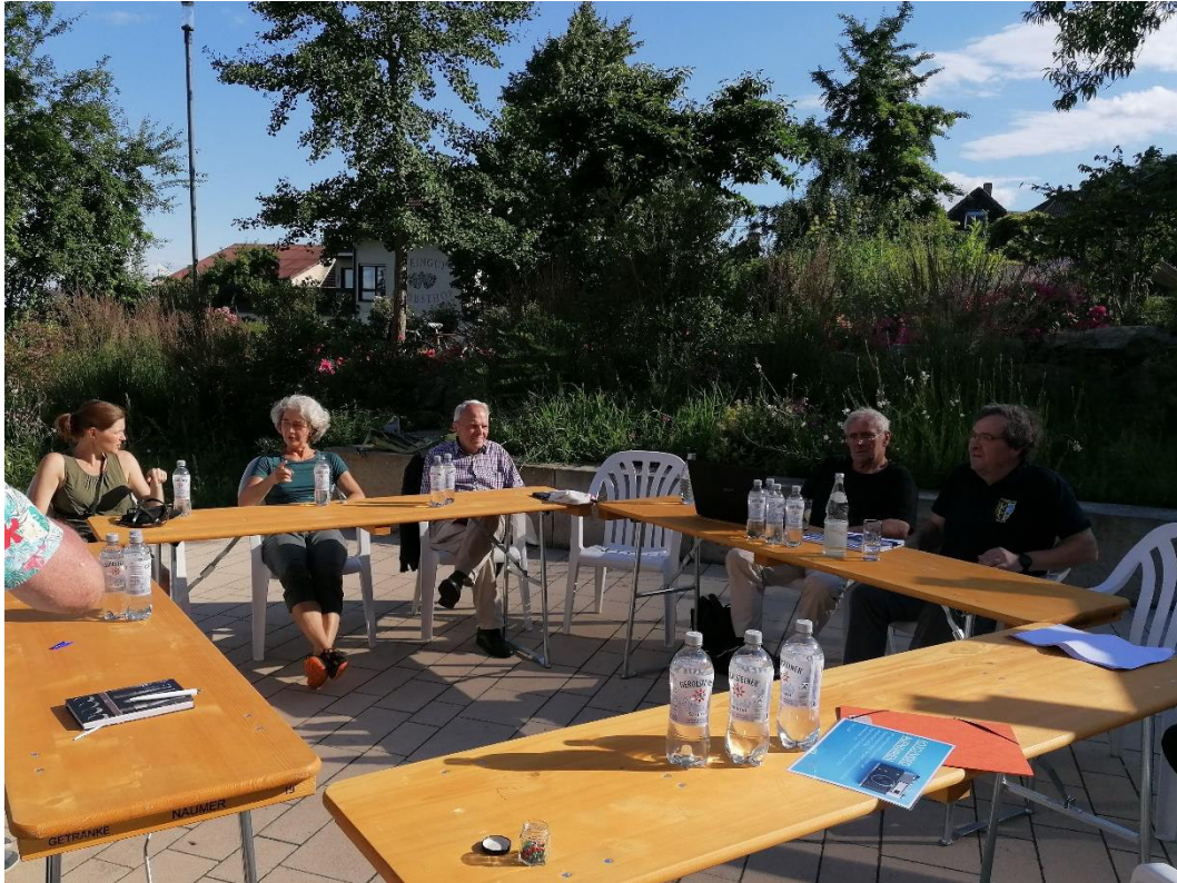
Abbildung 1: Arbeitstisch Leitprojekte, eigene Aufnahme 7.7.21

Mit circa 30 interessierten Bürgerinnen und Bürgern der Haardt wurde am 07.07.21 gemeinsam auf dem Dorfplatz diskutiert und Ergebnisse erarbeitet. Ziel war es, das Leitbild für die Haardt zu konkretisieren und dessen Inhalte fertigzustellen.